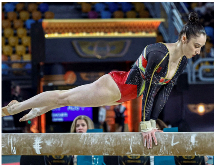
Nina DERWAEL - Sportive Belge